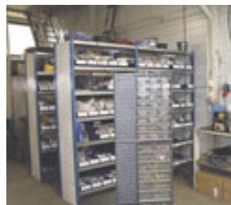
Tällä hetkellä MPN – Metallipaja Niemisen hyllyssä on 300–400 erilaista hydraulikkakomponenttia ja valikoima täydenty jatkuvasti.